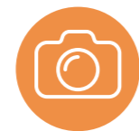
FOTO KOTIČEK Nadgradite svoj CV s prepričljivo fotografijo

Se sprašujete, kako napisati dober življenjepis? Vrhunske HR-specialiste MojeDelo.com, ki posameznikom na njihovi karierni poti svetujejo že vrsto let, lahko obiščete na Karierni točki MojeDelo.com in jim zastavite vprašanja, povezana z izzivi pri pisanju CV-ja.